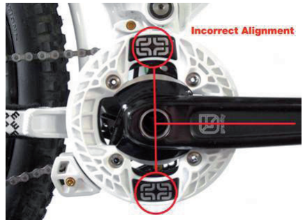
Abb. 2 – falsche Montage/montage faux keine Garantie/pas de garantie